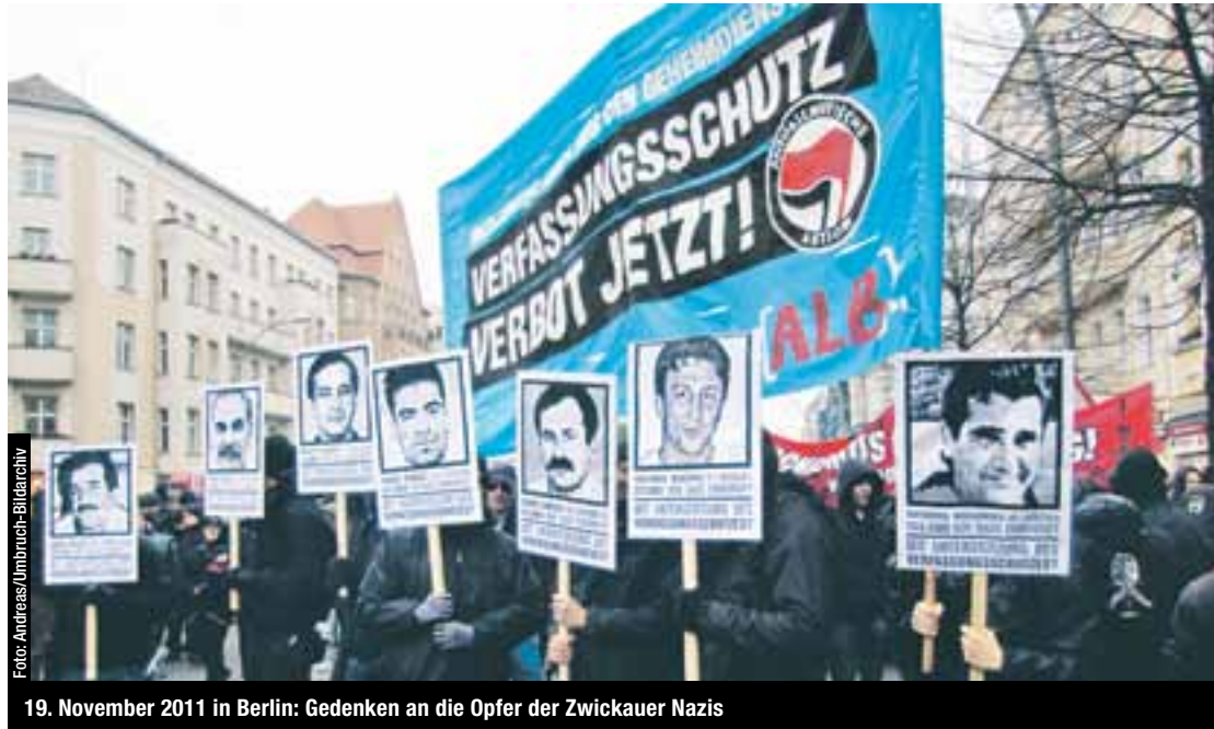
19. November 2011 in Berlin: Gedenken an die Opfer der Zwickauer Nazis

Jetzt ist von »Pannen« und »Versäumnissen« die Rede. Was aber sind die Ursachen dieser »Versäumnisse«? Hauptursache dürfte sein, dass sowohl die verantwortlichen Politiker als auch die Zuständigen in Polizei und Geheimdiensten auf dem rechten Auge weitgehend blind sind. Sie sehen den Gegner und die Hauptgefahr auf der linken und der islamistischen Seite. Die von den Neonazis ausgehenden Gefahren und Gewalttaten werden bagatellisiert. Hauptursache für diese Fehleinschätzung und die daraus resultierenden »Versäumnisse« ist das Weltbild dieser Politiker und Behördenleiter: Für sie stand und steht der Feinde auf der Linken. Das hat in einzelnen Fällen sogar eine Übereinstimmung mit Rechtsextremisten zur Folge. So lange das so bleibt, wird es am konsequenten Kampf gegen Rechtsextremismus und Neofaschismus mangeln. Das muss sich ändern.