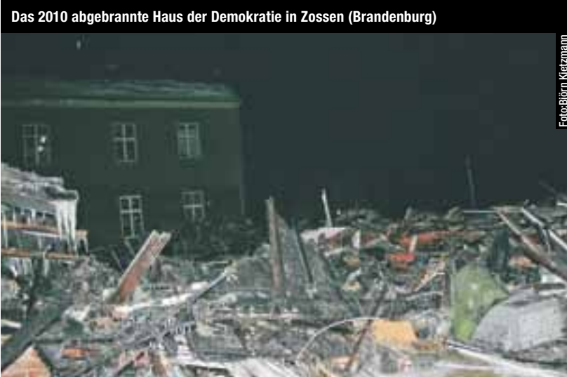
Das 2010 abgebrannte Haus der Demokratie in Zossen (Brandenburg)