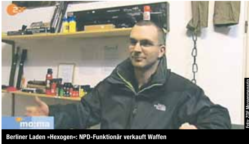
Berliner Laden »Hexogen«: NPD-Funktionär verkauft Waffen

Im bayerischen Fürth wurde am 26. November 2011 das Auto einer Familie angezündet, die sich gegen Neonazismus engagiert.