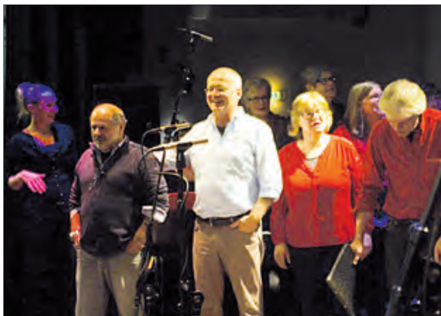
Abschluss des großartigen Kulturprogramms