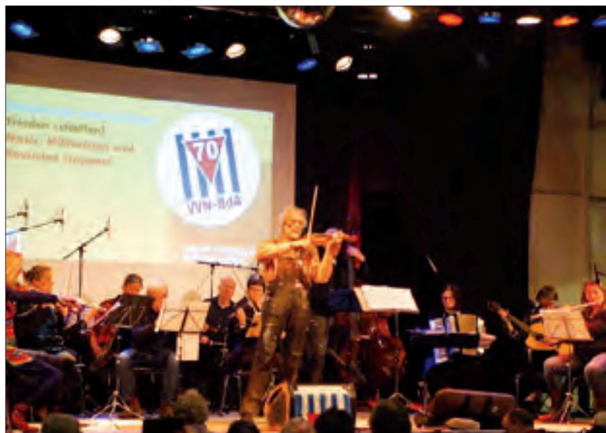
Eindrucksvolle Interpretation von Astor Piazzollas „Libertango“