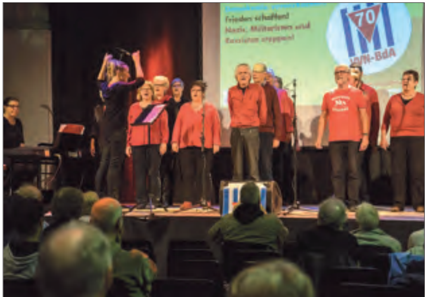
Der IG-Metall-Chor CHORosion aus NRW