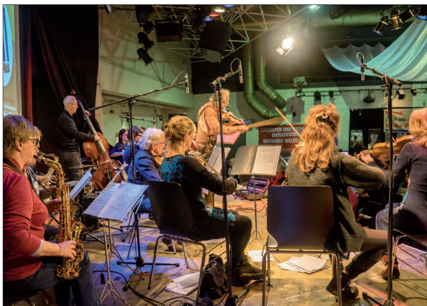
... mit dem Orchester des Kölner Kultursalons