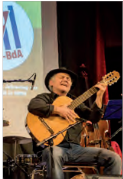
Texte rezitiert von Andreas Weißert und vorgetragen von Peter Sturm