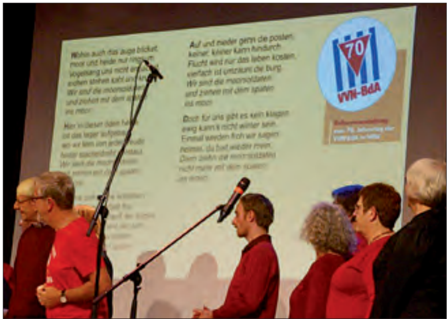
Der IG-Metall-Chor CHORosion singt gemeinsam mit dem Publikum das Lied „Die Moorsoldaten“