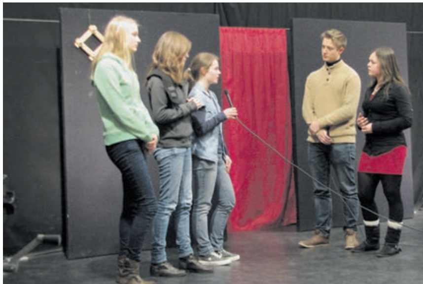
Die Moderatoren sprechen mit Schülerinnen über ihre Projektarbeit