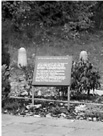
Gedenkstätte Schießplatz Höltigbaum

Nach dem Krieg gab es einige Prozesse gegen einzelne Kriegsrichter. Die Ausstellung betont aber ausdrücklich: In Westdeutschland