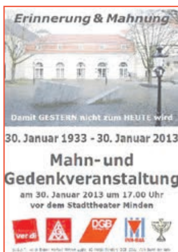
Flyer von der Veranstaltung in Minden

In Oberhausen und Dülmen wurde Ortsgeschichte neu geschrieben