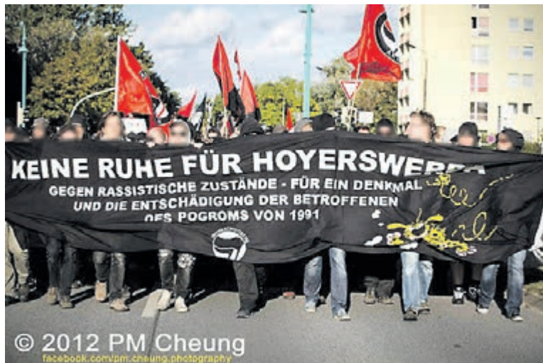
Demonstration im September 2012.

Schon seit 1993 ist die Regionale Arbeitsstelle für Bildung, Demokratie und Lebensperspektiven (RAA) Hoyerswerda/Ostsachsen e.V. bemüht, rechtsextremistische und menschenverachtende Ideologien und Einstellungen zurückzudrängen. Als Beitrag zur politisch-historischen Bildung und als aktive Prävention gegen Rechtsextremismus initiiert und organisiert die VVN-BdA Hoyerswerda gemeinsam mit der RAA seit 1995/96 das Projekt »Wider das Vergessen«, an dem sich jährlich fünf Hoyerswerdaer Schulen beteiligen.