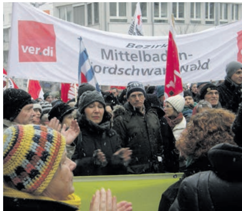
Kundgebung am Bahnhof als Auftakt der Proteste gegen den Fackelaufmarsch der Nazis