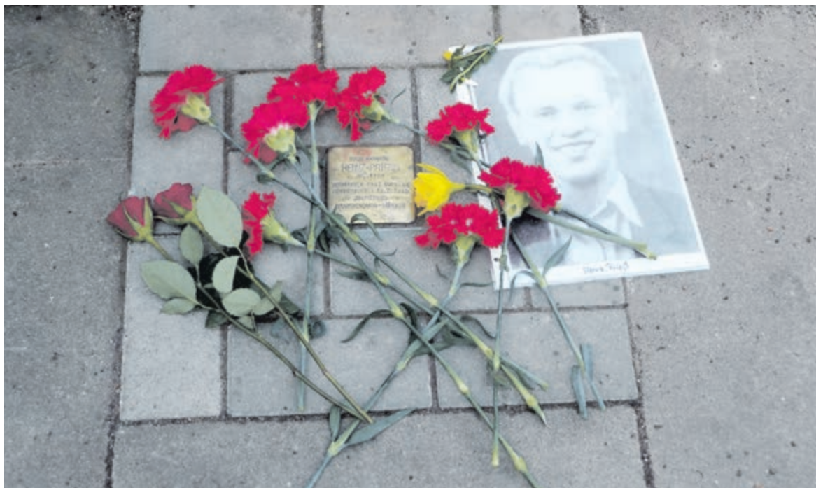
Stolperstein für Heinz Prieß, verlegt am 10. Februar 2013