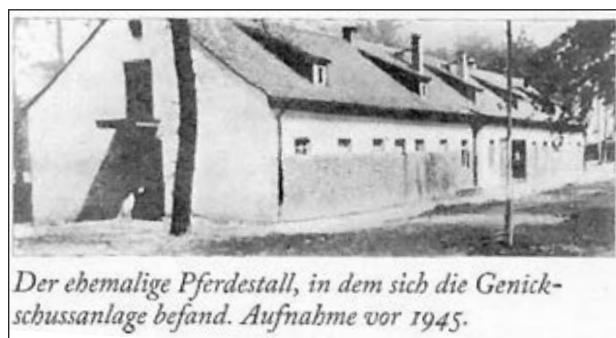
Der ehemalige Pferdestall, in dem sich die Genickschussanlage befand. Aufnahme vor 1945.

heute Gedenksteine, die Zeugnis von diesen Verbrechen ablegen.