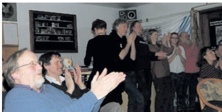
Das Haus Heideruh in Buchholz/Nordheide bot wieder eine gute Seminaratmosphäre.

in Mali, die Verteidigung langfristiger Auslandseinsätze in Kundus zeigen, dass die Bundeswehr weltweit am Schutz von Wirtschaftsressourcen beteiligt ist. Monty Schädel wies auf die Umstellungsproblematik hin, die einem deutschen Wehrbeitrag durch die Schaffung einer Freiwilligenarmee erwachsen sind. Verstärkt werden Jugendliche durch Werbung für den Einsatz geködert, in allen Medien, Plakatwänden, über Fernsehen, mit gezielten Postsendungen, durch Jobcenter und Gewerkschaft. Der Schwerpunkt liegt auf Darstellung umfangreicher Karriere- und Ausbildungsmöglichkeiten. Der Trend scheint in Richtung Rekrutierungszentren wie in den USA zu laufen.