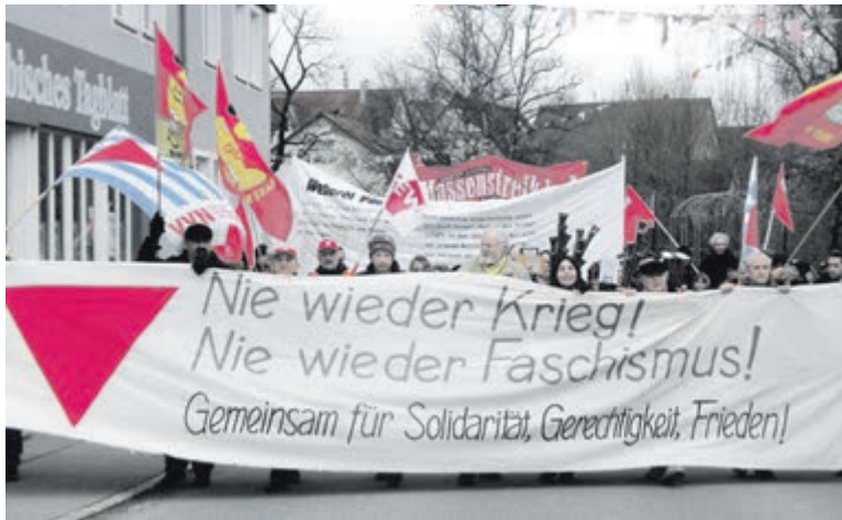
1200 demonstrieren zur Erinnerung an den Generalstreik durch Mössingen