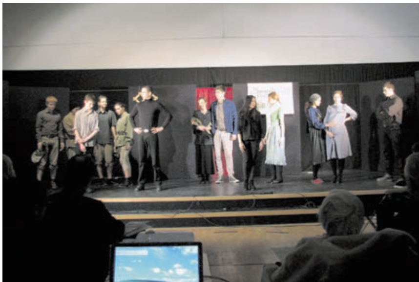
Schüler/innen präsentieren Szenen aus Bertolt Brechts »Furcht und Elend des Dritten Reiches«