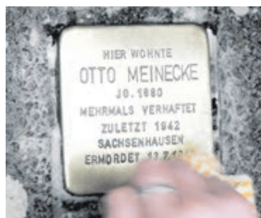
Auch dieser Stolperstein wurde gereinigt.

Aus den Publikationen der NPD und in zahlreichen Veröffentlichungen der Medien wird eine menschenverachtende Diskriminierung von Homosexuellen sichtbar. Die inzwischen erfochtenen Gleichheitsrechte für gleichgeschlechtliche Paare